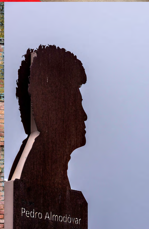
Espacio Pedro Almodovar en Calzada de Calatrava.